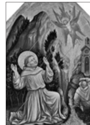
Gentile da Fabriano, «Św. Franciszek otrzymuje stygmaty» (1420 r.)

14 rozpoczęła się wizyta w « eremo delle carceri », grocie na zboczach góry Subasio, w której gromadzili się św. Franciszek i jego pierwsi towarzysze, by modlić się i medytować. Po powrocie do Asyżu Papież odwiedził katedrę św. Rufina, w której zostali ochrzczeni św. Franciszek i św. Klara; tam odbyło się spotkanie z duchowieństwem oraz braćmi i siostrami zakonnymi, a także świeckimi członkami rad duszpasterskich. Papież wygłosił do nich przemówienie, w którym zachęcił do słuchania Słowa Bożego i głoszenia go na peryferiach egzystencji. W niedległej bazylice św. Klary spotkał się z siostrami klauzurowymi, modlił się przy grobie ich założycielki oraz przed krzyżem z kościoła św. Damiana; w improwizowanym przemówieniu m.in. wezwał klaryski, by żyły swoim powołaniem z radością, z uśmiechem, a także poprosił je o modlitwę. W bazylice Matki Bożej Anielskiej, gdzie udał się następnie, modlił się w Porcjunkuli, a na placu przed bazyliką spotkał się z młodzieżą i wygłosił do niej przemówienie w odpowiedzi na przygotowane przez nią wcześniej cztery pytania. Po tym ostatnim spotkaniu odwiedził jeszcze sanktuarium Matki Bożej w Rivortorto, gdzie znajduje się tzw. Sacro Tugurio , chatki z kamieni, w których św. Franciszek mieszkał z pierwszymi towarzyszami. Po pożegnaniu z przedstawicielami władz kościelnych i cywilnych Papież z boiska sportowego w Rivortorto odleciał helikopterem do Rzymu.