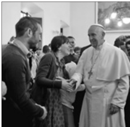
Na zakończenie spotkania Ojciec Święty wypowiedział następujące słowa:

Dzisiaj prosimy tutaj o łaskę dla wszystkich chrześcijan. Niech Pan da nam wszystkim odwagę do ogołocenia się, nie z 20 lirów, ale z ducha świata, który jest trądem, jest rakiem społeczeństwa. To jest rak objawienia Bożego! Duch świata jest wrogiem Jezusa! Proszę Pana, by nam wszystkim dał tę łaskę, byśmy się ogołocili. Dziękuję!