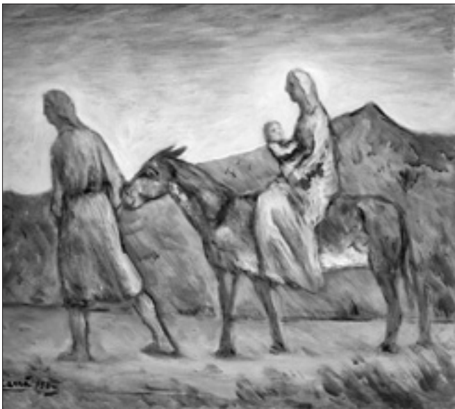
Carlo Carrà, «Ucieczka do Egiptu» (1958 r.)

Kościół, który wypełnia polecenie Chrystusa: «Idźcie i nauczajcie wszystkie narody», powołany jest do tego, by być ludem Bożym, obejmującym wszystkie ludy, i wszystkim ludom głosi Ewangelię, ponieważ w obliczu każdej osoby odzwierciedla się oblicze Chrystusa! W tym tkwi najgłębszy korzeń godności istoty ludzkiej, którą należy zawsze szanować i chronić. Podstawą godności osoby są nie tyle kryteria efektywności, wydajności, pozycji społecznej, przynależności etnicznej bądź religijnej, lecz fakt, że jesteśmy stworzeni na obraz i podobieństwo Boga (por. Rdz 1, 26-27), a jeszcze bardziej fakt, że jesteśmy dziećmi Boga; każda istota ludzka jest dzieckiem Boga! Odcisnięty jest w niej wizerunek Chrystusa! Chodzi zatem o to, byśmy dostrzegli jako pierwsi i pomagali innym widzieć w migrancie i uchodźcy nie tylko problem, w którym