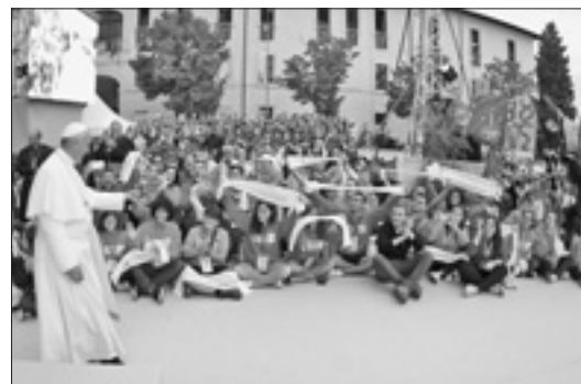
Przemówienie Papieża Franciszka

Cieszymy się, że możemy być tu z Ojcem Świętym i słuchać słów, które dodają odwagi i rozgrzewają serce. Rok Wiary, który zakończy się za kilka tygodni, przypomniał na nowo wszystkim wierzącym pilną potrzebę głoszenia Dobrej Nowiny. Również my chcielibyśmy uczestniczyć w tej niezwykle przygodzie. Ale jak? Jaki mógłby być nasz wkład? Co powinniśmy uczynić?