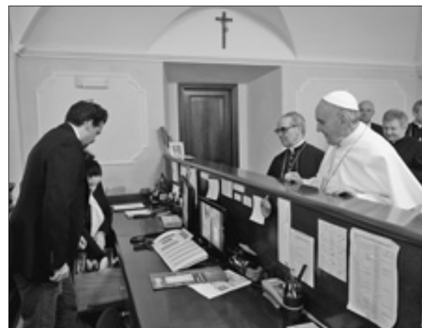
Papież Franciszek płaci za noclegi w hotelu, w którym mieszkał przed rozpoczęciem konklawe

18 III – W Domu św. Marty Ojciec Święty przyjął prezydenta Argentyny Cristinę Elisabeth