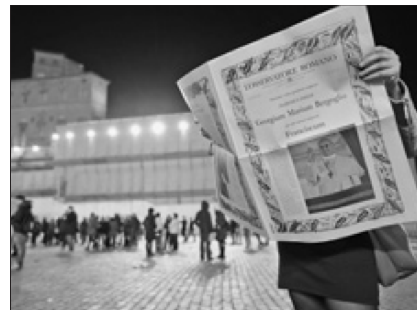
Specjalny numer «L'Osservatore Romano», który ukazał się po wyborze Papieża

14 III – Rano Papież udał się na modlitwę do bazyliki Matki Boskiej Większej, a w drodze powrotnej do Domu św. Marty – swojej obecnej rezydencji w Watykanie – zatrzymał się na chwilę w Domus Internationalis Paulus VI, gdzie mieszkał przed rozpoczęciem konklawe, by za-